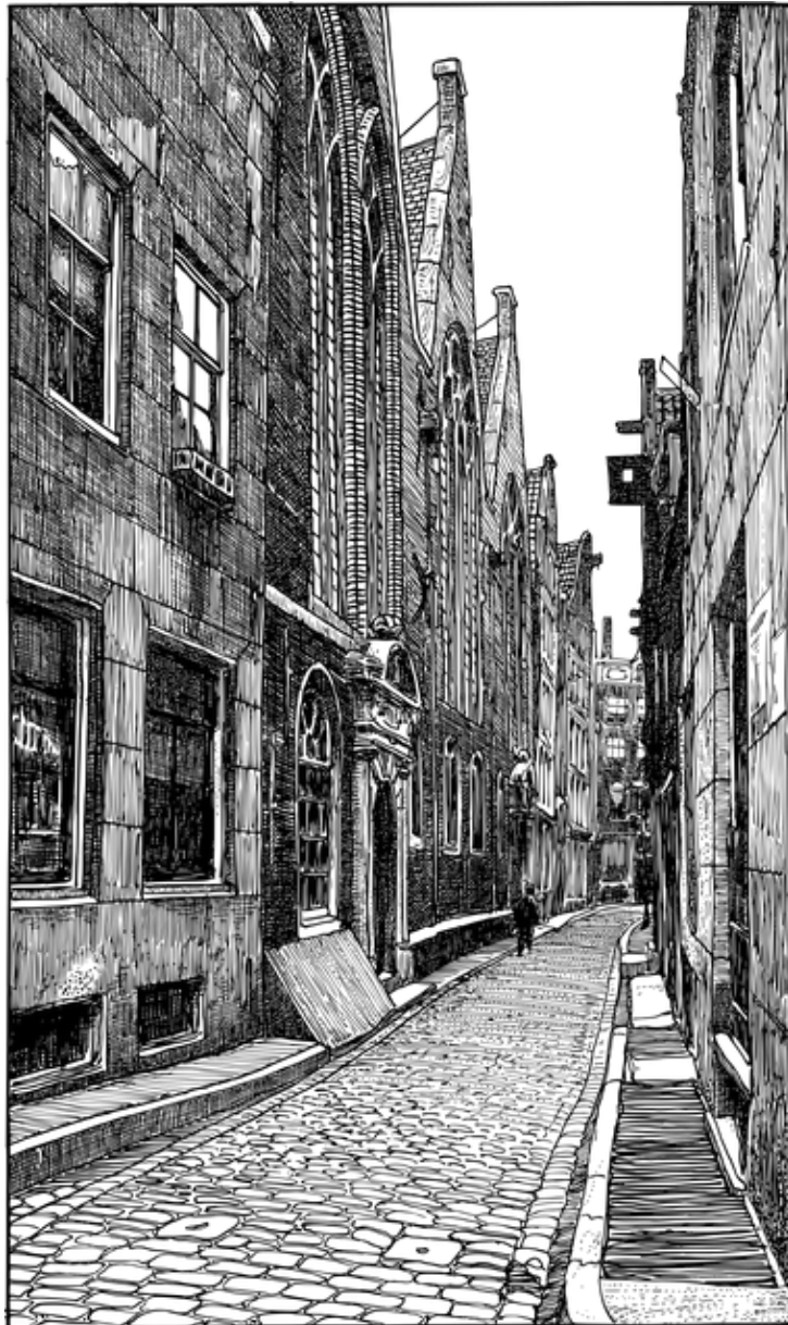
Rue d'une ville